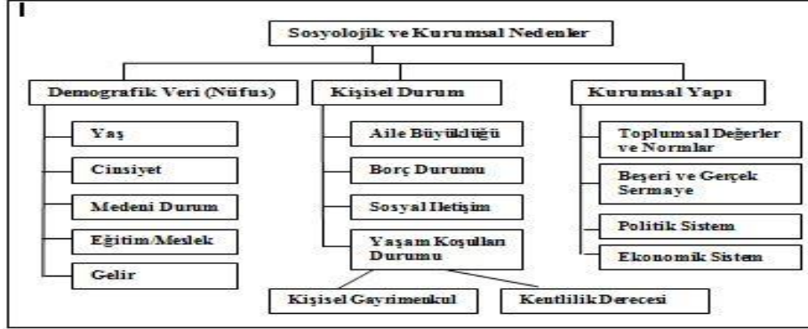
Şekil 1. Kayıt dışı Ekonominin Sosyo-Politik ve Kurumsal Nedenleri

Kaynak: Schneider, F. ve Enste, D.,H., 2003