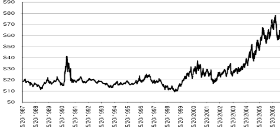
Şekil 2. Tahmini İhracat Hacmine Göre Ağırlıklandırılmış FOB Petrol Spot Fiyat (Varil Başına Dolar Olarak)

Gelir yaratıcı kaynakların oldukça oynak olması durumunda bazı problemler ortaya çıkmaktadır. Bu problemlerden en önemlisi, özellikle ticari malın değerinde yaşanan dalgalanmaların yol açtığı gelecekteki belirsizliğin ekonominin uzun dönem planlanmasını güçleştirmesidir. Belirsizlikle ilgili ya da sermaye piyasası eksiklikleri ile ilgili oynaklıklar söz konusu olmasa dahi, bu ticari malları satan alan ülkelerin harcama düzeyinde oynaklıklar meydana gelmektedir. Durgunluk yıllarında harcamalar kısılırken, canlanma dönemlerinde son derece yüksek harcamalar yapılmaktadır. Bu durum, konjonktür dalgalanmalarının sırasıyla “dip ve zirve” evrelerini geçirmelerine yol açmaktadır. Genellikle ekonominin canlanma dönemlerinde sağlanan faydalar geçici bir nitelikteyken, daralma dönemlerinde ortaya çıkan problemler uzun süre kalıcı olabilmektedir.